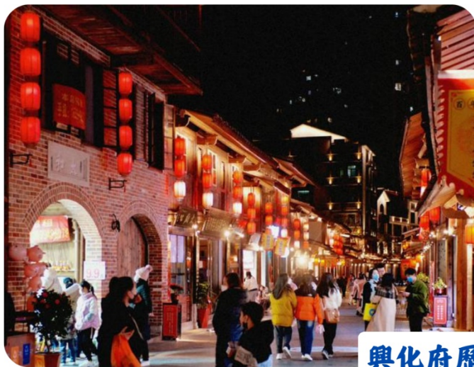
興化府歷史文化街

【興化府歷史文化街】是莆田歷史文化名城的核心組成部分，街區內有着街巷格局保存完好的大路街、縣巷、後街、衙後路、廟前路和坊巷等 6 條古街，連片的明清古建築構成了具有莆田地方傳統特色的風貌區。