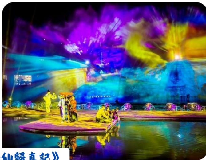
水幕秀《修仙歸真記》

註：水幕秀表演，以現場園區公告為主，如因景區、天氣原因或客人自身原因無法觀看，則無法退費，煩請見諒。